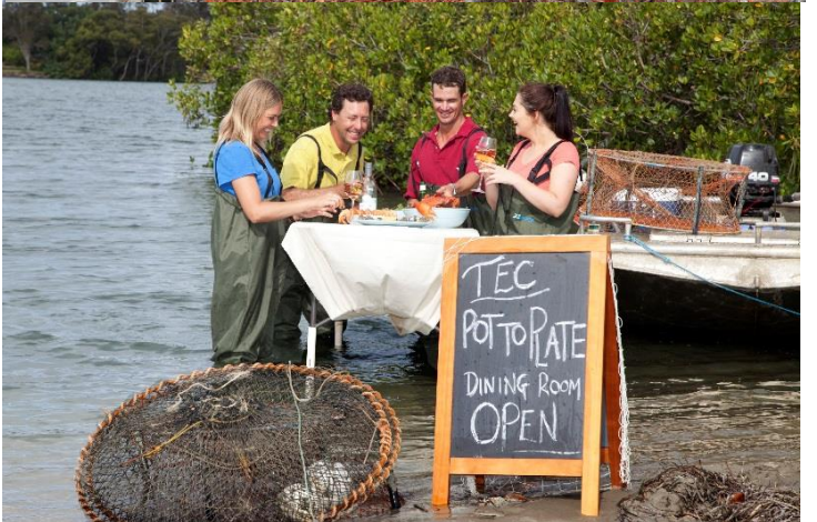
그물에서 식탁까지 프리미엄 투어. 샌드뱅크 저녁! ($550 투어시 제공)